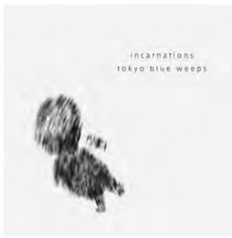
『incarnations』 tokyo blue weeps 1st album 2011.4.6 release